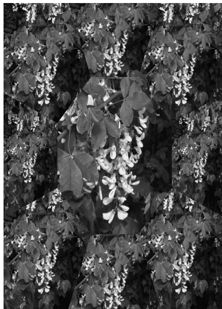
Autor: Patryk Kujawski - uczeń gimnazjum