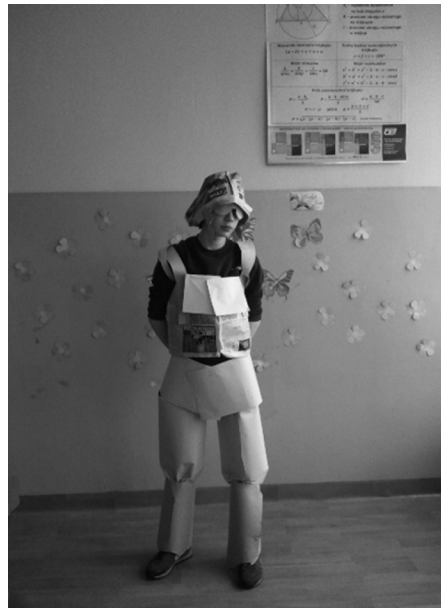
Nauczyciel dokumentuje pracę uczniów